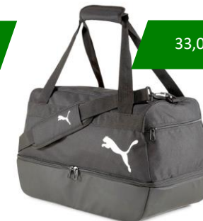
Nr. 14 - Football Bag Gr. S (46x23x24 - 24L) Gr. M (60x29x31 - 54L) Gr. L (77x33x32 - 81L)