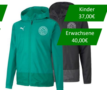
Nr. 9 - Hooded Jacket Kinder Gr. 116-176 Erwachsene Gr. S-3XL